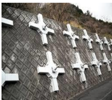
【写真1】今回使用する受圧板の形状 【写真2】施工例