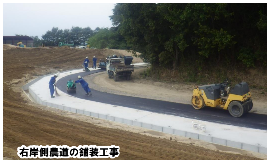
右岸側農道の舗装工事

右岸側農道の舗装工事を行いました。 工事も終盤になり、各所で仕上げ工事を行っています。