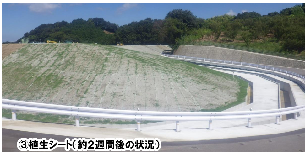
③ 植生シート(約2週間後の状況)